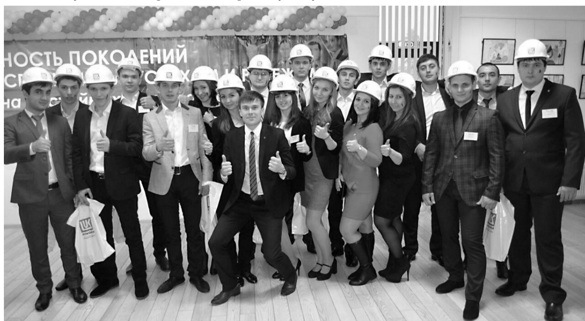
В большинстве своем, деятельность Совета молодых специалистов не выносится на публичное обозрение, а преследует самую благородную цель — оказание помощи тем, кто в ней нуждается.

- Я уверен, что в Молодежную палату войдут активные, инициативные, равнодушные к проблемам общества и города молодые люди, которые поведут за собой молодежь и помогут ей объединиться. В первую очередь, мы будем работать на результат. Сегодня есть много нерешенных молодежных проблем, среди которых алкоголизм, наркомания, отсутствие качественного досуга. Задача молодых политиков — помогать решать эти вопросы. Я вижу работу Молодежной палаты в тесном сотрудничестве с городской Думой, молодежью, городскими структурами. Только работая в команде, мы сможем достичь желаемого результата.